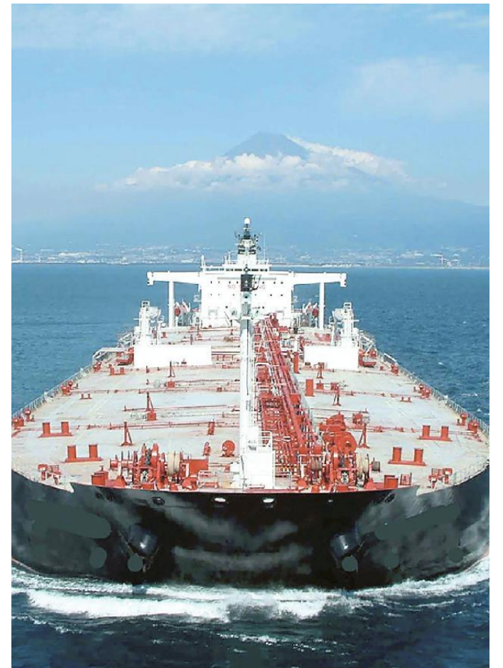
Una petroliera Vlcc (Very large crude carrier)

Il tempo non è più denaro. Così quelle navi partite dal Far East per l'Europa non hanno interesse ad arrivare prima ed evitano di tagliare attraverso il Canale di Suez. Il Capo di Bu-